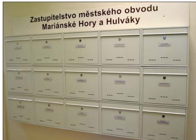
POŠTOVNÍ SCHRÁNKY zastupitelů v přízemí budovy A radnice Mariánských Hor a Hulvák.