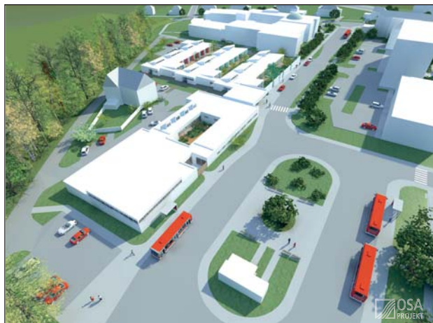
SITUAČNÍ schéma přestupního uzlu.