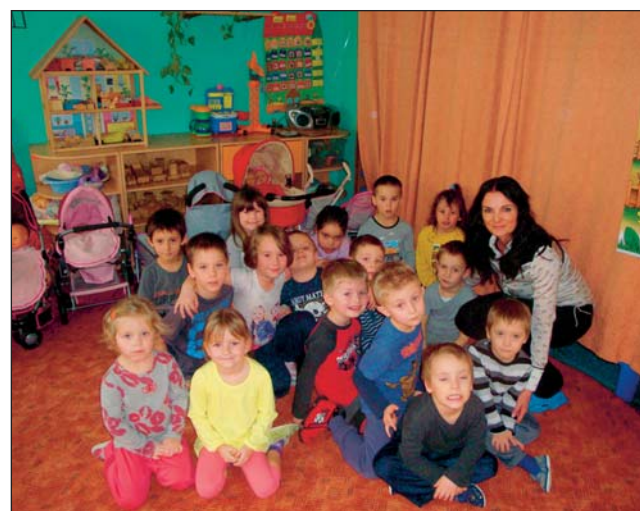
TŘÍDĚ SLUNÍČEK z Křesťanské mateřské školy se natáčení Čertovských kvítek hodně líbilo. Reportérce rádia děti například prozradily, proč jsou pejskové na vodítku a co dělá právník.