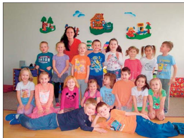
DĚTI ze třídy Motýlci z Mateřské školy Gen. Janka odpovídaly třeba na otázky, proč se lidé berou, z čeho se vyrábí gumový medvídek a k čemu slouží kancelářský koník.

Jako ve většině rádií, i v Rádiu Radnice je možné nechat si zahrát podle vlastního výběru. Písničky na přání se od začátku dubna vysílají pravidelně každé úterý a čtvrtek mezi 13. a 14. hodinou. Kromě výběru oblíbeného interpreta a jeho písně mohou posluchači také někoho prostřednictvím vysílání Rádia Radnice pozdravit anebo někomu něco vzkázat. V ulicích městského obvodu Mariánské Hory a Hulváky se totiž pohybuje s mikrofonem reportér rádia, kterému mohou zájemci své přání nadiktovat a vzkaz říct osobně. Pokud ale reportéra nepotkáte anebo se například stydíte mluvit do mikrofonu, můžete svůj požadavek i se vzkazem jednoduše napsat a poslat na e-mail pisnickynapranir@radoradnice.cz .