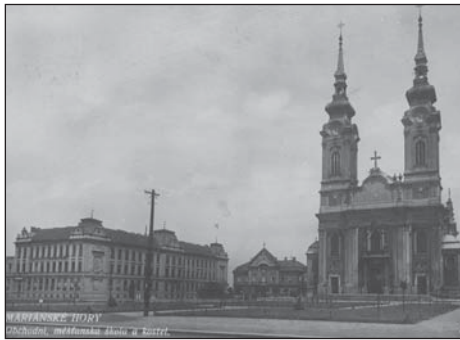
STOJANOVO NÁMĚSTÍ v roce 1930